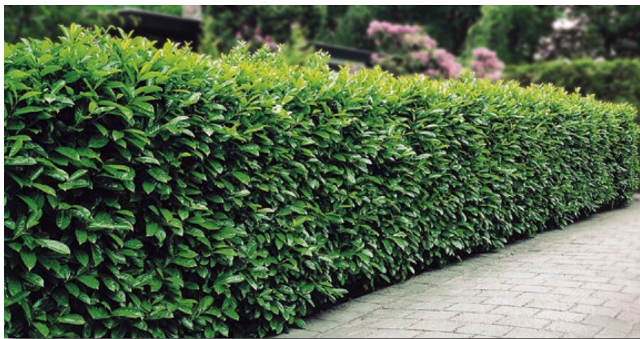
Kirschlorbeer wird oft als Sichtschutz eingesetzt. Liguster oder Buchs sind gute einheimische Alternativen.

Problematisch an ihnen ist, dass sie am Gartenzaun nicht haltmachen, sondern sich auch in die freie Natur ausbreiten. Um dies zu verhindern, beurteilen wir Ihren Pflanzenbestand, eliminieren die invasiven Neophyten und zeigen Ihnen einheimische Pflanzen, an denen Sie sich genauso freuen.