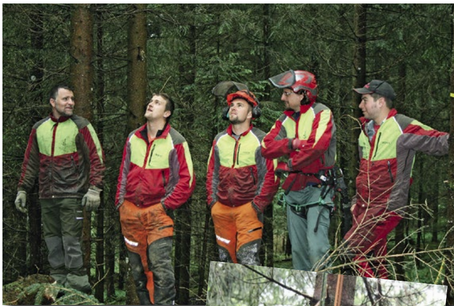
Volle Aufmerksamkeit für die Anweisungen des Instructors in luftiger Höhe.

Interessantes zum Thema finden Sie unter www.baumklettern.ch .